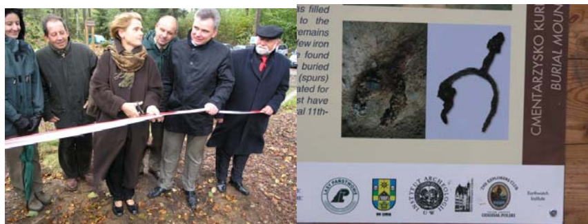
Otwarcie skansenu w Lewinie. Fragment planszy.