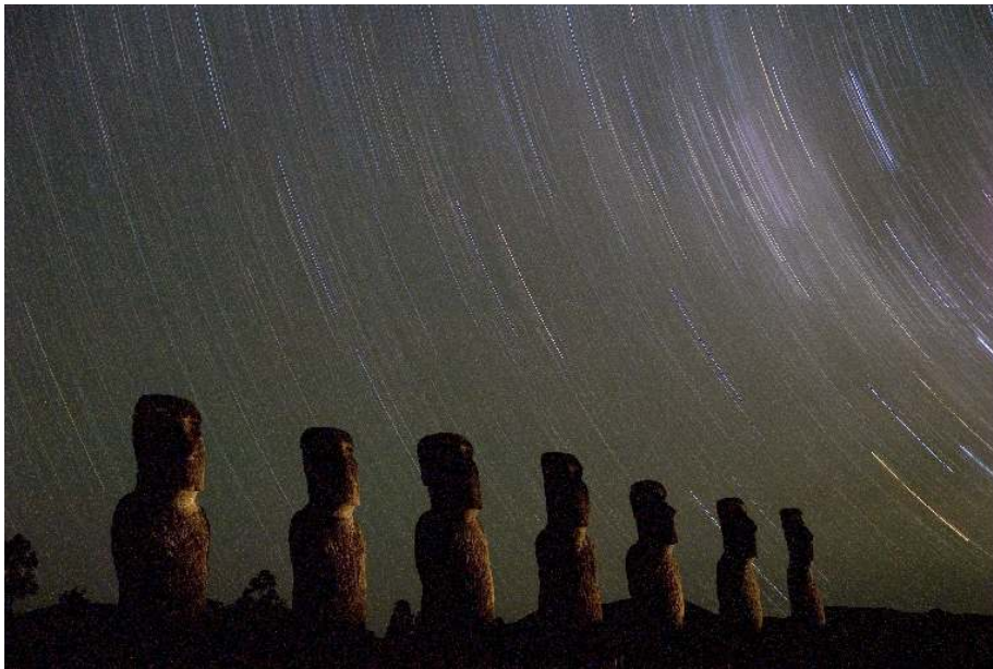
Posągi moai na Wyspie Wielkanocnej.