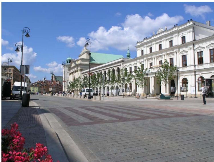
Krakowskie Przedmieście w Warszawie. Dom Polonii pierwszy z prawej.