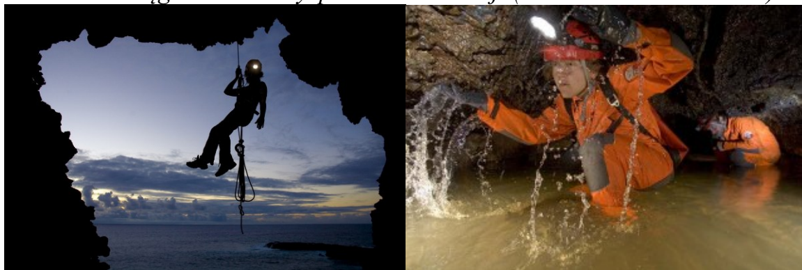
Polskie ekspedycje prowadzone przez Andrzeja Ciszewskiego zlokalizowały i przebadaly 320 jaskiń Wyspy Wielkanocnej.